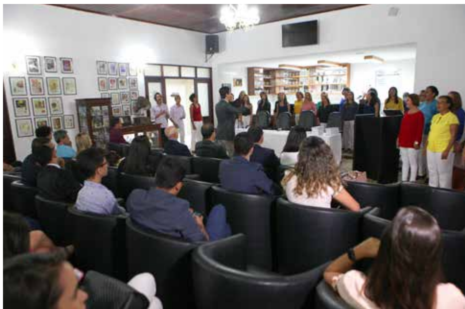
Coral do Judiciário participou da cerimônia de lançamento da revista eletrônica.

Na terceira edição do evento, foram colocados em evidência estudos que abordavam, de forma direta ou indireta, a eficiência das instituições públicas em todos os seus aspectos. Também houve contribuições sobre a qualidade da prestação jurisdicional.