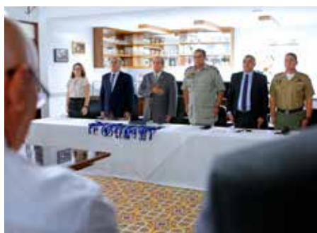
Autoridades do TJ/AL e da PM/AL participaram da cerimônia de entrega dos certificados dos assessores de segurança.