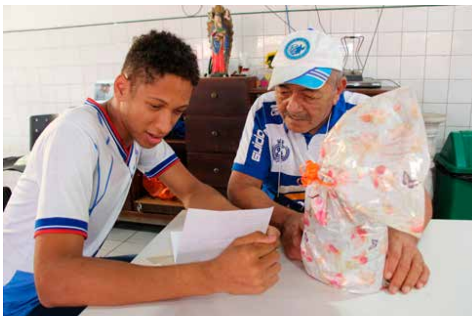
Estudantes entregaram os presentes e leram as cartas escritas pelos padrinhos dos senhores que moram no abrigo.