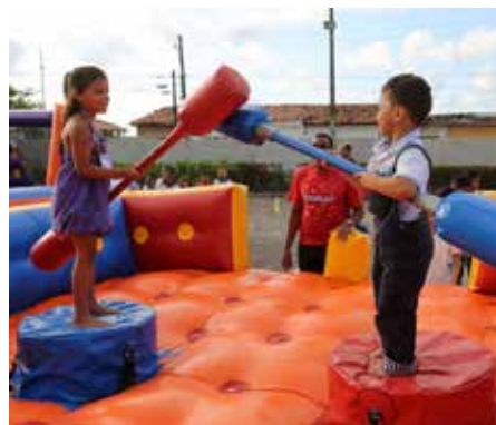
Inovando mais uma vez, o PCJE levou brinquedos e lanches para as crianças.

Com o tema “Transforme sonhos em realidade”, a campanha Natal Solidário 2018 coloriu e alegrou a vida de cerca de 170 crianças, com idades entre sete e nove anos. O projeto é realizado pela Esmal, por meio do PCJE, e contempla alunos da rede pública de ensino.