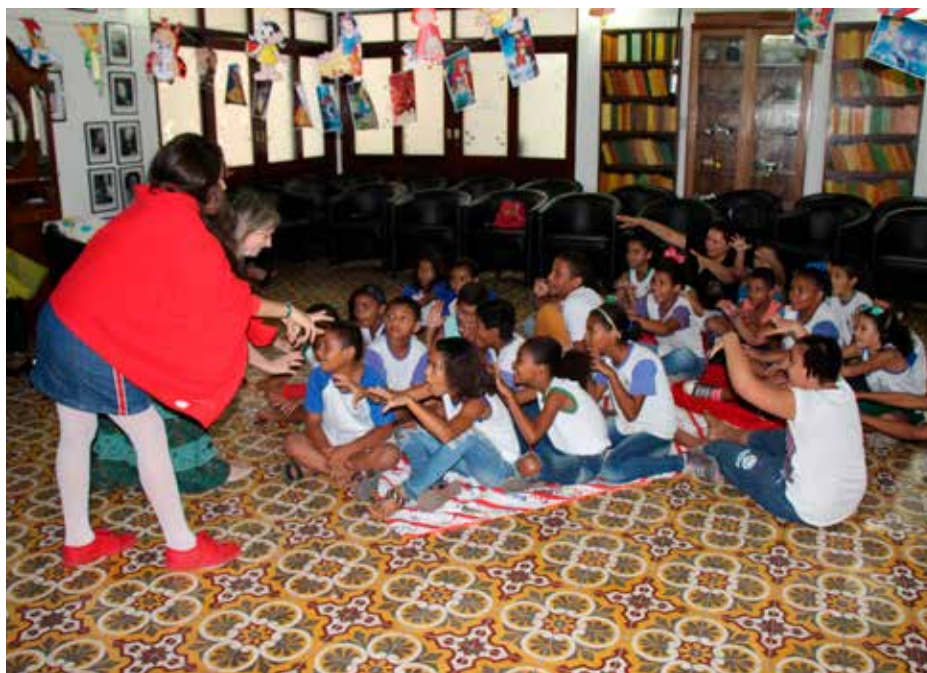
Crianças ficaram encantadas com os personagens da contação de histórias.

Terminal Web habilita magistrados e servidores a fazer consultas, renovar empréstimos, sugerir aquisições, selecionar itens favoritos e avaliar obras