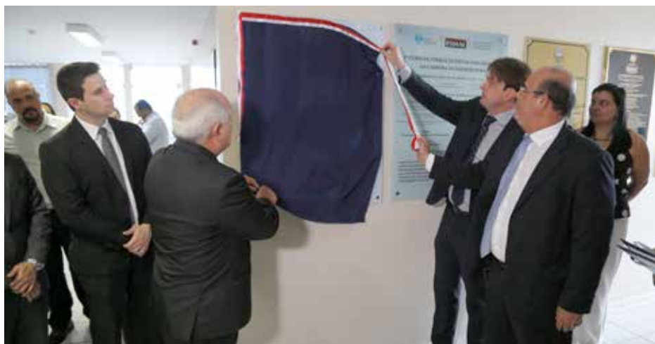
Turma de novos magistrados foi empossada em janeiro de 2018.

Na celebração, que contou com a cerimônia de aposição de foto do desembargador James Magalhães de Medeiros na galeria de ex-diretores da Esmal, Otávio Praxedes lembrou do esforço para que todos os aprovados no último concurso público fossem nomeados, apesar das dificuldades orçamentárias do Tribunal. Por sua vez, o desembargador Fernando Tourinho, homenageado como patrono da turma, comentou que após quase cinco meses de curso de formação, a aposição da placa da turma foi um momento de coroação de todo o esforço que os novos magistrados tiveram para garantir os seus lugares na magistratura estadual.