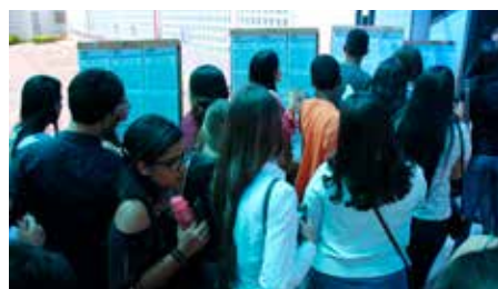
Mais de 1.200 estudantes de Direito participaram de concursos para estágio realizados na capital e em Arapiraca.

N o ano de 2018, a quantidade de estagiários atuando no Poder Judiciário de Alagoas aumentou 62% com relação ao ano anterior. Agora, as unidades do Tribunal de Justiça (TJ) contam com 483 estudantes, 148 deles no interior, contribuindo com a prestação jurisdicional. Os benefícios dessa relação chegam ao próprio estagiário, que alia o conhecimento adquirido na universidade com a prática profissional.