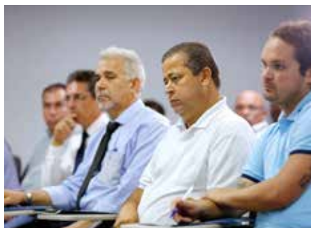
Assessores de segurança participaram da primeira aula, realizada na Esmal, no mês de junho.