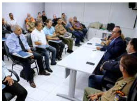
Desembargador Fernando Tourinho, diretor da Esmal, falou durante aula inaugural da capacitação.

O curso foi orientado por instrutores experientes e os cursistas tiveram acesso ao que há de mais moderno no que diz respeito a noções de segurança e estratégia. A formação aconteceu em duas etapas no mês de junho. A primeira, teórica, ocorreu na Esmal. Já a segunda fase, prática, foi realizada no Centro de Formação de Praças (CFAP).