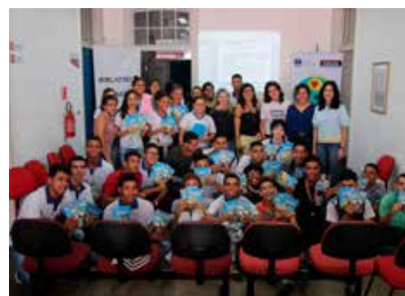
Em 2018, foram realizadas 11 visitas à Biblioteca Estadual Graciliano Ramos e participação de mais de 470 estudantes.