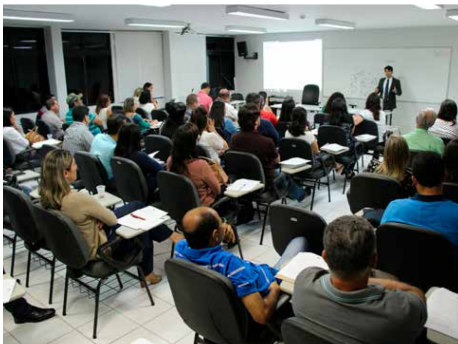
Um dos benefícios das alterações foi a diminuição da taxa de evasão nas capacitações.

Atualizações visam otimizar logística de administração e melhorar experiência dos cursistas