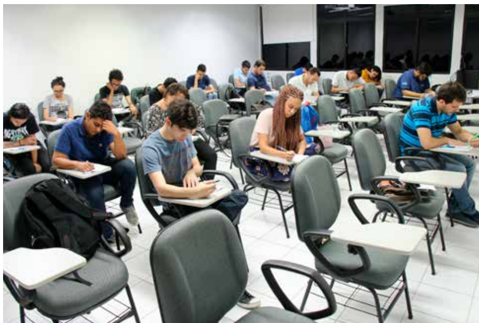
Processo seletivo para estágio em Jornalismo.

Estudantes atuam em diversas áreas profissionais e aprendem, na prática, a utilizar os conhecimentos adquiridos em sala de aula