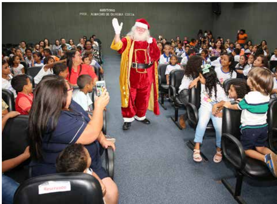
Chegada do Papai Noel encantou adultos e crianças.

Servidores e magistrados doaram brinquedos para alunos da rede pública de ensino