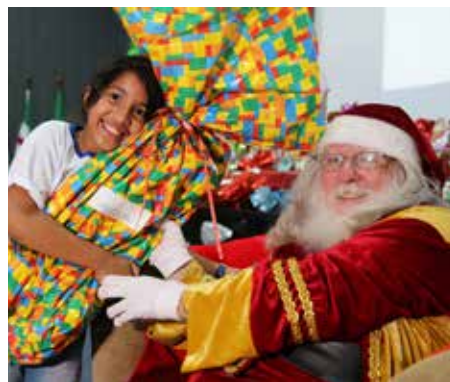
Presentes foram doados por servidores e magistrados do Judiciário.