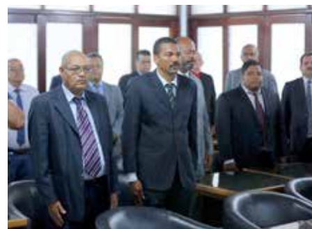
Cerca de 30 profissionais receberam certificados de capacitação durante cerimônia realizada em julho.