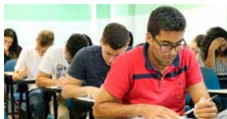
Unidades do TJAL contam com 483 estagiários.