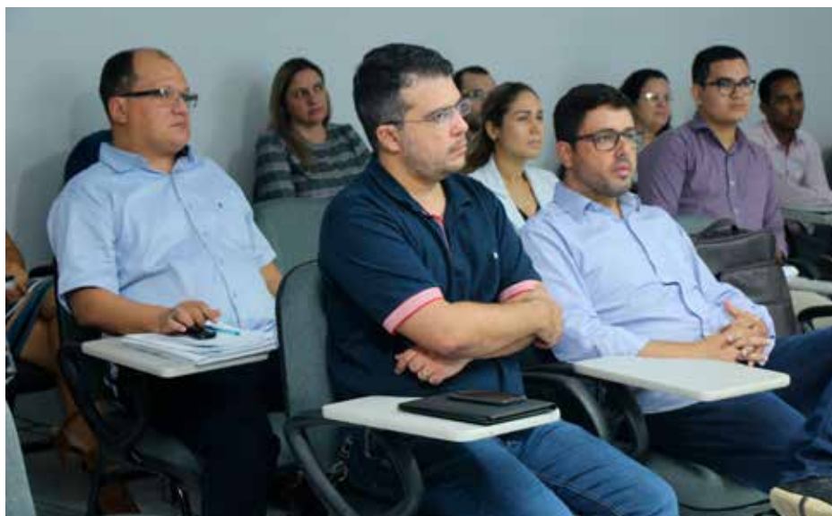
Aulas teóricas foram ministradas na sede da Esmal, em Maceió.