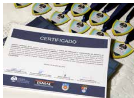
Assessores de segurança receberam medalhas e certificados de conclusão.