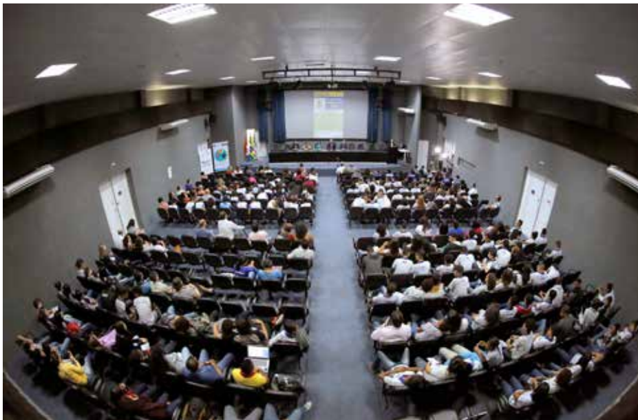
Mais de 250 pessoas lotaram o auditório da Esmal para participar de seminário sobre paz, cidadania e justiça.

Outro destaque foi a comemoração dos 10 anos do Encontro de Filiação e Paternidade em Alagoas