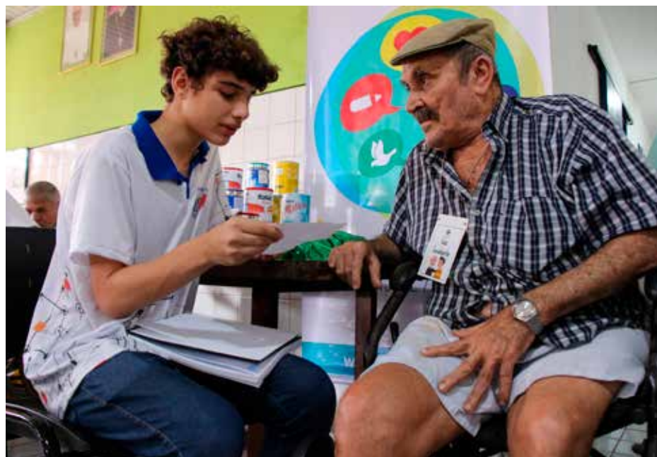
Estudante e idoso interagem durante promoção de projeto idealizado pelo PCJE.