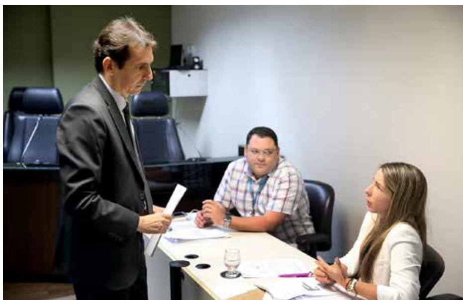
Esmal recebe contribuição de servidores para temas de cursos

Com a iniciativa, a instituição espera atender a demanda de qualificações de forma democrática, focando nos assuntos que mais interessam aos magistrados e servidores do Poder Judiciário.