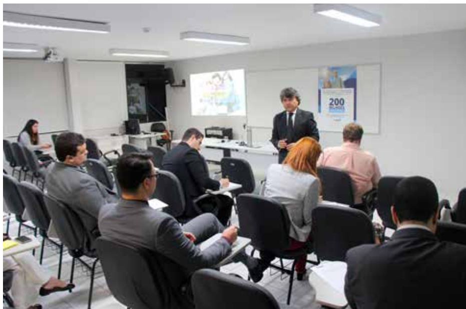
Juízes participam de consulta pública para opinar sobre cursos da Esmal em 2019